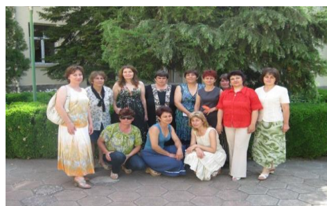
Училищният колектив през 2009/10 г.

В периода от 1976 до 1989 година училището провежда учебно-възпитателна работа с учениците при целодневен режим – сутрин учителите преподават новите знания, а следобед ръководят подготовката на учениците за следващия ден. За този експеримент училището е избрано от окръжния инспекторат – гр. В. Търново.