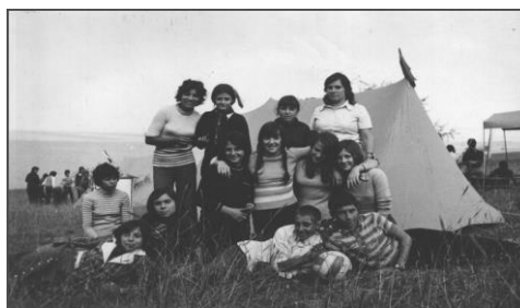
На палатки в м. “Занталъка”

За честването на 100-годишнината на училището активно участие вземат учениците, учителите, помощния персонал, родителите и предприятията на територията на село Моравя. Направена е идейно издържана украса на училището от свищовския художник Марко Волински. В деня на честването се открива музейна сбирка в училището, дело на учителския колектив.