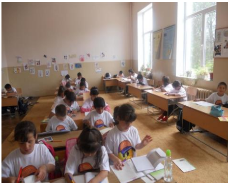
Занимания в ПИГ