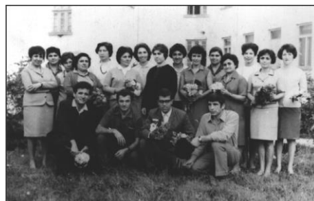
Учителският колектив през 1972 г.