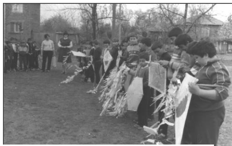
Празник на хвърчилата