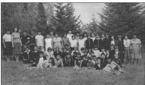
Лагер в с. Беброво 1983 г.