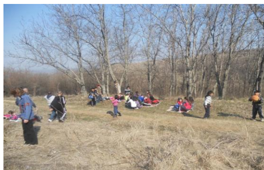
Посрещане на пролетта в Деляновската гора

От 2001 год. е възстановено честването на патронния празник на училището - 11 май - Ден на светите братя Кирил и Методий според Юлианския календар. Енорийският свещеник отец Евгений тържествено освещава иконата на Св. Св. Кирил и Методий, подарена на училището от Кметството и извършва водосвет на сградата, всички ученици и учители. В официалната документация училището се именува “ Св. Св. Кирил и Методий “.