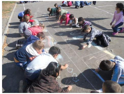
Рисунка на асфалт