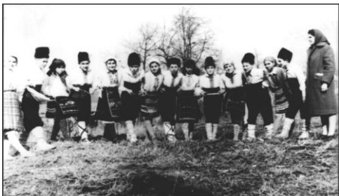
Участници в художествена самодейност

Провеждат се рецитали, викторини, вечери и др. Трайни ще останат в съзнанието на учениците тържествата за честване славния юбилей на България – 1300 год. от нейното създаване, празниците около детската асамблея “Знаме на мира”.