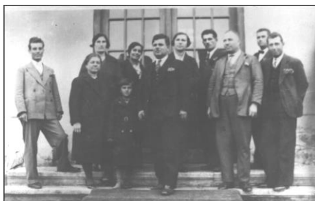
Учителският колектив през 1933 г.