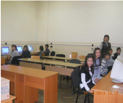
В компютърния кабинет