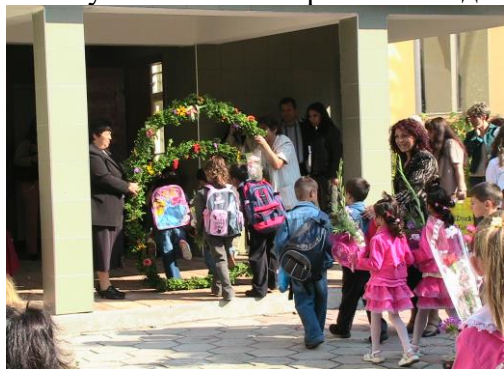
Откриване на учебната година