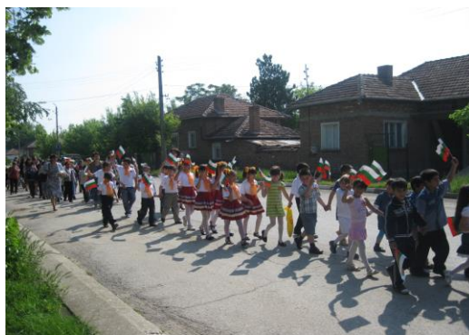
Шествие за празника на славянската писменост

След поземлената реформа, в резултат на дълги съдебни дела, през 2002 год. е възстановена собствеността на училището върху горите – 412 дка. Поради невъзможност да бъде върната собствеността върху училищните земи, училището получава компенсаторни бонове. Благодарение на средствата, получени от продажба на част от тях е направен наложителния от много време външен ремонт на сградата и е обновена почти изцяло материалната база на училището. Сменя се обзавеждането в класните стаи, закупуват се учебни пособия, съобразно новите учебни програми. Разширява се фонда на училищната библиотека с учебници и учебно-помощна литература. Осигуряват се безплатни учебници за всички ученици въпреки трудностите и проблемите.. Обзаведен е модерен компютърен кабинет, който се използва пълноценно в учебно-възпитателния процес.