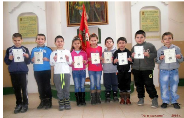
Награждаване на участниците в конкурси