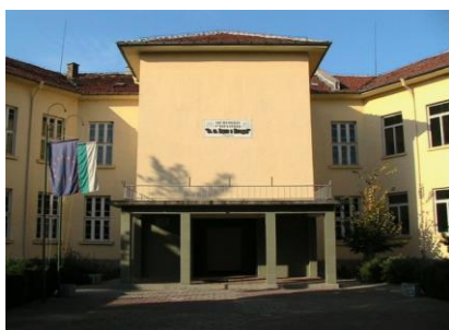
Съвременната сграда на училището

За честването на 100-годишнината на училището активно участие вземат учениците, учителите, помощния персонал, родителите и предприятията на територията на село Моравя. Направена е идейно издържана украса на училището от свищовския художник Марко Волински. В деня на честването се открива музейна сбирка в училището, дело на учителския колектив.